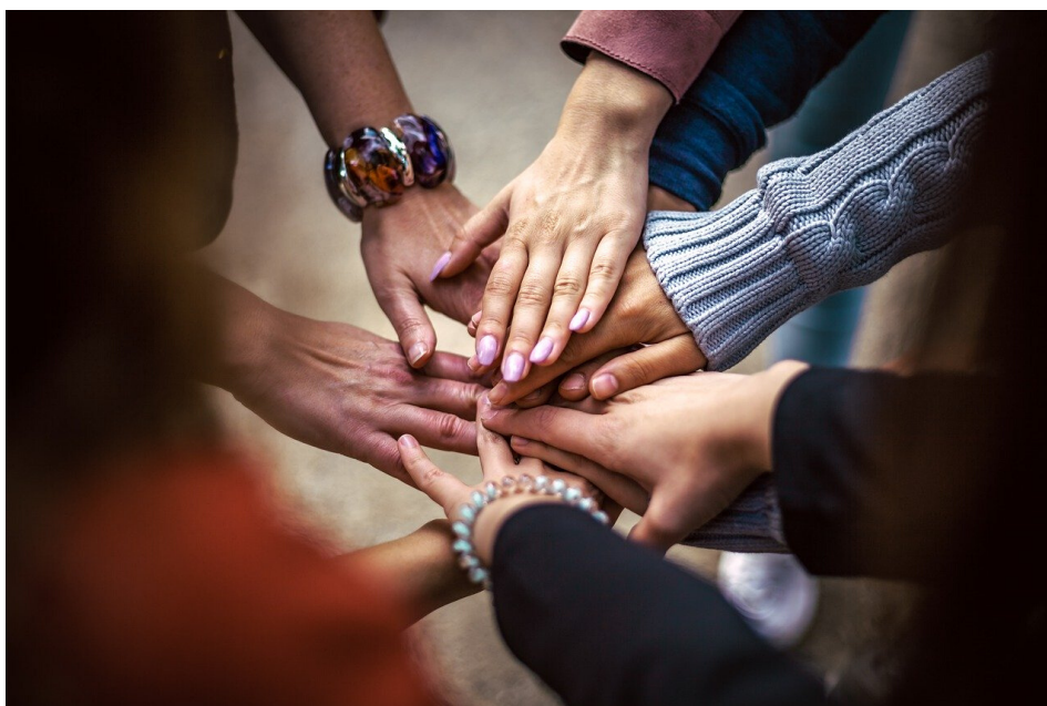
Ilustrační fotografie.

Po vašem příjezdu vás tamní organizace seznámí s někým místním, který bude vaším mentorem. Není přímo spojen s místní organizací (např. nemá tam pracovní poměr), ale není jím na druhou stranu cizí. Úkolem mentora je vám třeba ukázat okolí místa, kde žijete, seznámit vás s místní kulturou, vzít vás někde na párty nebo na výlet, apod. Pokud máte nějaký problém se svým koordinátorem, a bojíte se to řešit přímo s ním, mentor by měl být schopen vám s tím pomoci.