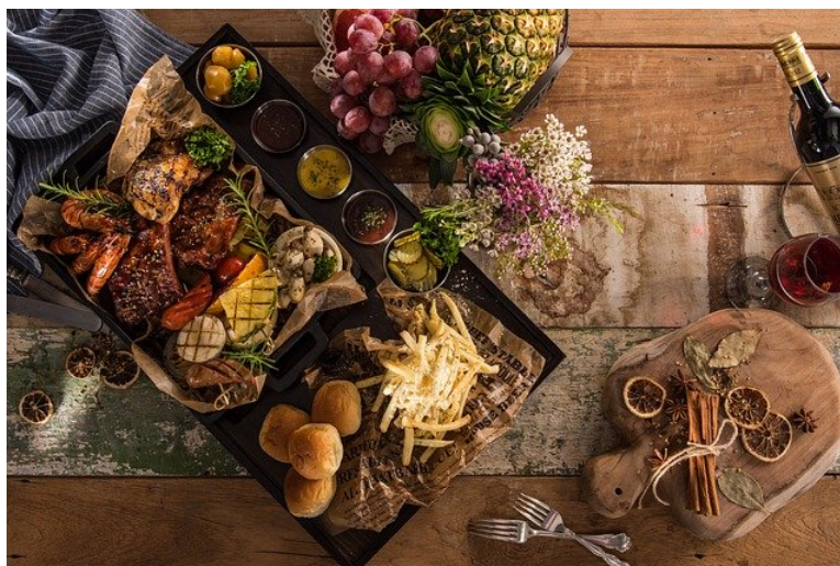
Ilustrační fotografie.

S jídlem je to jinak než s ubytováním. V drtivé většině případů si jídlo obstaráváte sami z kapesného , které budete dostávat každý měsíc. Záleží jen na vás, zda si chcete vařit a ušetřit, nebo si naopak v levnějších zemích dopřeje chodit do restaurací či místních jídelen. Místo, kde budete bydlet, bude na vaření vybavené, rozhodnutí je tedy na vás. Častokrát si dobrovolníci vaří i dohromady a naučí se tak recepty a kulturu stolování jiných zemí.