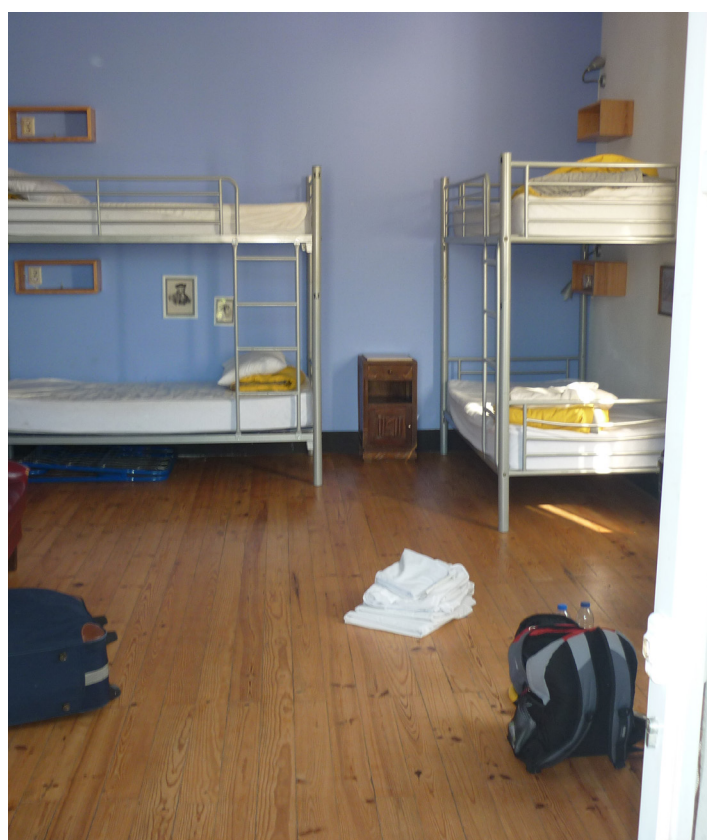
Pokoj v hostelu v Portugalsku