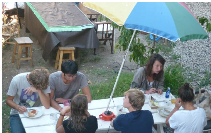
Společná snídaně v hostelu